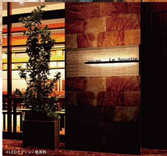
※LEDオプション使用例