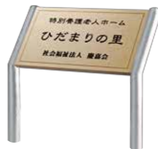
ANA-301 クリスタール(ローマンベージュ) 参考価格 172,500円(税抜) ● クリスタール 500W×300H×20T(mm) 約6.9kg ● 彫刻 黒&素彫 ● 書体:細隸書&明朝体 ● 脚 ステンレスHL折曲げ 約1200H×38φ(mm)(省略図 B) 約4.2kg