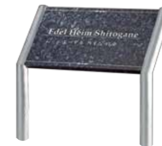
ANA-302 ブルーパール 参考価格 172,500円(税抜) ● ブルーパール 500W×300H×20T(mm) 約8.9kg ● 彫刻 白 ● 書体:パラディーノ&明朝体 ● 脚 ステンレスHL折曲げ 約1200H×38φ(mm)(省略図 B) 約4.2kg