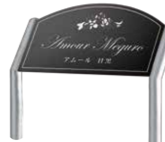
ANS-106 ステンレスブラック板ドライエッチング 参考価格 192,500円(税抜) ● ステンレスブラックHL 600W×350H×2T(mm) 約2.9kg ● ドライエッチング 凹シルバー ● 書体:ワーディアンスクリプト&明朝体 ● 脚 ステンレスHL折曲げ 約1200H×38φ(mm)(省略図 C) 約3.7kg