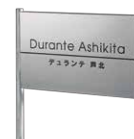
ANS-107 ステンレスドライエッチング 参考価格 132,500円(税抜) ● ステンレスHL 500W×300H×20T(mm) 約2.1kg ● ドライエッチング 凹黒 ● 書体:アバンテ&角ゴシック ● 脚 ステンレスHL直 約1200H×38φ(mm)(省略図 G) 約3.1kg