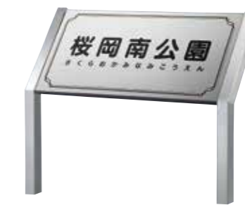
ANS-104 ステンレスドライエッチング 参考価格 147,500円(税抜) ● ステンレスHL 600W×300H×20T(mm) 約2.4kg ● ドライエッチング 凹黒 ● 書体:丸ゴシック ● 脚 ステンレスHL折曲げ 約1200H×35φ(mm)(省略図 E) 約3.9kg