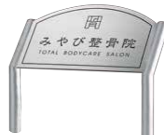
ANS-105 ステンレス板ドライエッチング 参考価格 165,000円(税抜) ● ステンレスHL 600W×350H×3T(mm) 約4.3kg ● ドライエッチング 凹黒 ● 書体:細隸書&アバンテ ● 脚 ステンレスHL折曲げ 約1200H×38φ(mm)(省略図 C) 約3.7kg