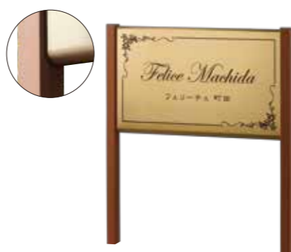
ANS-103 ステンレスゴールドドライエッチング 参考価格 170,000円(税抜) ● ステンレスゴールドHL 500W×300H×20曲(mm) R加工 約2.6kg ● ドライエッチング 凹ブラウン ● 書体:ワーディアンスクリプト&細隸書 ● 脚 ウッド調アルミ直 約1200H×25W×40D(mm)(省略図 I) 約1.5kg