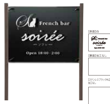
ANW-201 ガラス調アクリル&ステンレスブラック 参考価格 185,000円(税抜) ● ガラス調アクリル 500W×400H×5T(mm) 約4.3kg ● 彫刻 白 ● ステンレスブラックHL 500W×400H×2T(mm) ● 書体:ガラモンド&レージ&細隸書 ● 脚 ウッド調アルミ直 約1300H×25W×40D(mm)(省略図 J) 約1.7kg