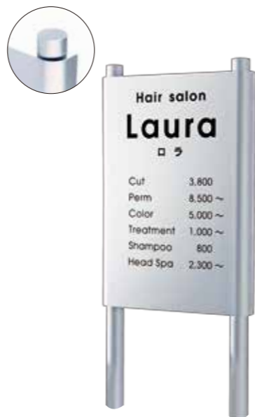
ANS-101 ステンレスドライエッチング 参考価格 200,000円(税抜) ● ステンレスHL 350W×500H×44曲(mm) R加工 約3.1kg ● ドライエッチング 凹黒 ● 書体:アバンテ(B) & 角ゴシック & アバンテ ● 脚 ステンレスHL直 約1200H×38φ(mm)(省略図 K) 約3.9kg