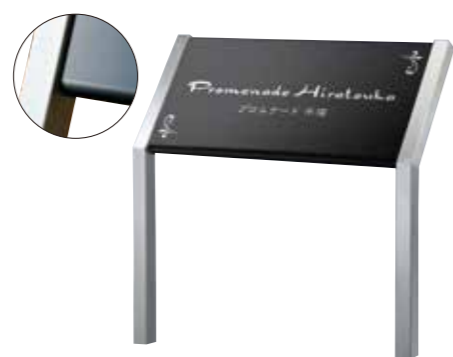
ANS-102 ステンレスブラックドライエッチング 参考価格 180,000円(税抜) ● ステンレスブラックHL 600W×300H×20曲(mm) R加工 約3kg ● ドライエッチング 凹シルバー ● 書体:ドラゴニア&細隸書 ● 脚 ステンレスHL折曲げ 約1200H×35φ(mm)(省略図 E) 約3.9kg