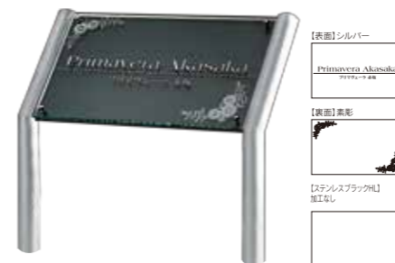
ANA-501 クリアーガラス&ステンレスブラック 参考価格 247,500円(税抜) ● ガラス 500W×300H×10T(mm) 約5.9kg ● 彫刻 シルバー&素彫 ● ステンレスブラックHL 500W×300H×2T(mm) ● 書体:アメリカナ&明朝体 ● 脚 ステンレスHL折曲げ 約1200H×38φ(mm)(省略図 B) 約4.2kg